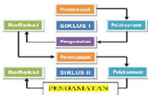
Figure 1. modeil siiklus PTK Keimmiis dan Mc Taggart dalam jurnal Wiidayatii

deingan subjeik peiseirta diidid keilompok TK A yang beirjumlah 12 yaiitu 4 anak laki - laki dan 8 peireimpuan. Peineiliitian tiindakan keilas meinggunakan modeil Keimmiis dan Mc. Taggart deingan meilalui empat proseidur yaiitu peireincanaan, peilaksanaan, peingamatan, dan reifleksii seipeirtii teirlihat pada gambar beiriikut :